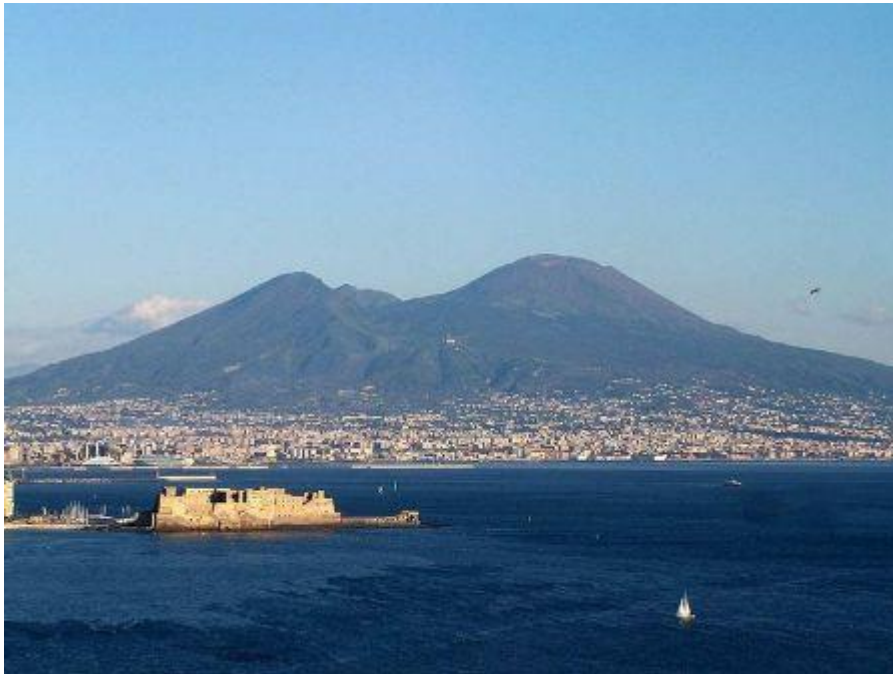
Afb. 3: De Vesuvius

In 79 na Christus vond de gewelddadigste uitbarsting van de Vesuvius plaats. Ongeveer 10.000 mensen vonden de dood en enkele steden tussen de vulkaan en de kust werden bedolven onder een stroom van lava, modder en stenen. De twee beroemdste steden zijn Herculaneum en Pompeii, waarvan je de ruïnes tegenwoordig nog kunt bezoeken. Bijna 1700 jaar hebben deze steden onder de grond gelegen en wist men slechts nog van hun bestaan uit de Romeinse literatuur. Pas in de 18 e eeuw werd Pompeii teruggevonden, toen de koning van Napels besloot opgravingen te doen.