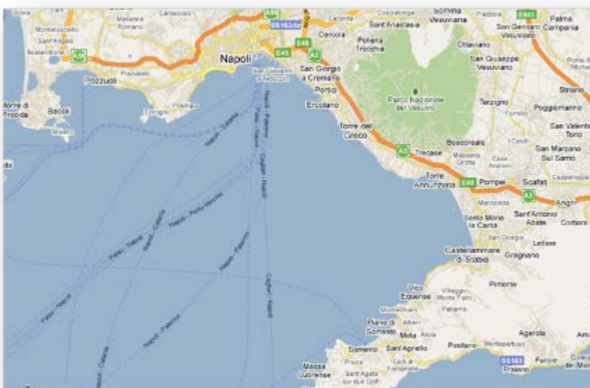
Afb. 2: De Golf van Napels met langs de A3 Napoli (Napels), Ercolano (Herculaneum) en Pompeii. Midden tussen deze steden ligt de Vesuvius, die hier een vredige groene heuvel lijkt...

Zoals je op het kaartje hiernaast kunt zien, ligt er midden in het gebied een vulkaan, de Vesuvius. Deze behoort tot de zestien gevaarlijkste vulkanen ter wereld, omdat hij nog kan gaan werken, en omdat hij in zo'n dichtbevolkt gebied ligt. Eigenlijk zou Napels in zijn geheel