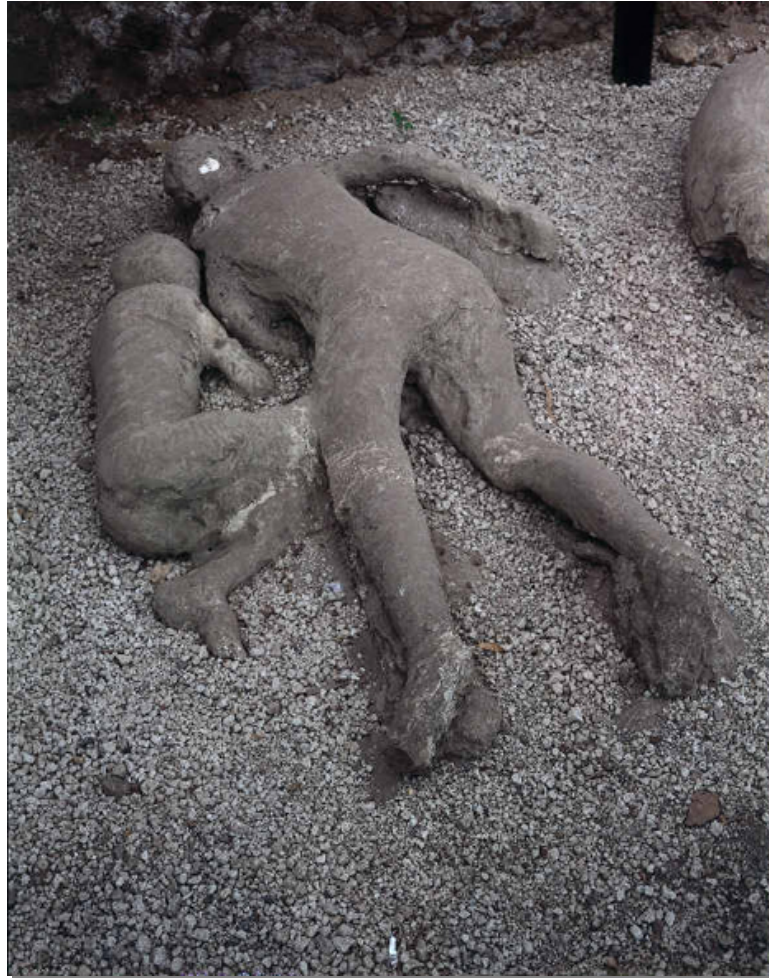
Afb. 4: Twee versteende slachtoffers van de vulkaanuitbarsting

maar hier was het nacht, donkerder dan alle andere nachten, en toch op vele plaatsen verhelderd door rossige schijnsels en diverse lichten."